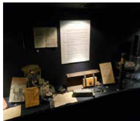
Trois vues des actuelles salles dédiées aux parachutistes français du Spécial Air Service (SAS)