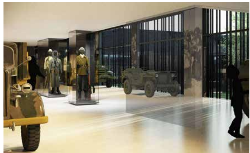
Quelques esquisses de l'intérieur du futur musée © Cadmée-AST-Gruet-Peutz-LTP