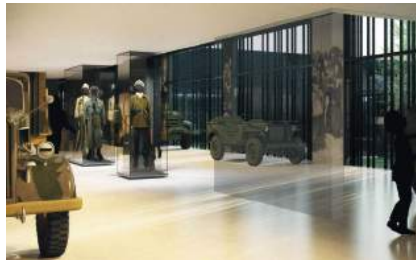
Quelques esquisses de l'intérieur du futur musée