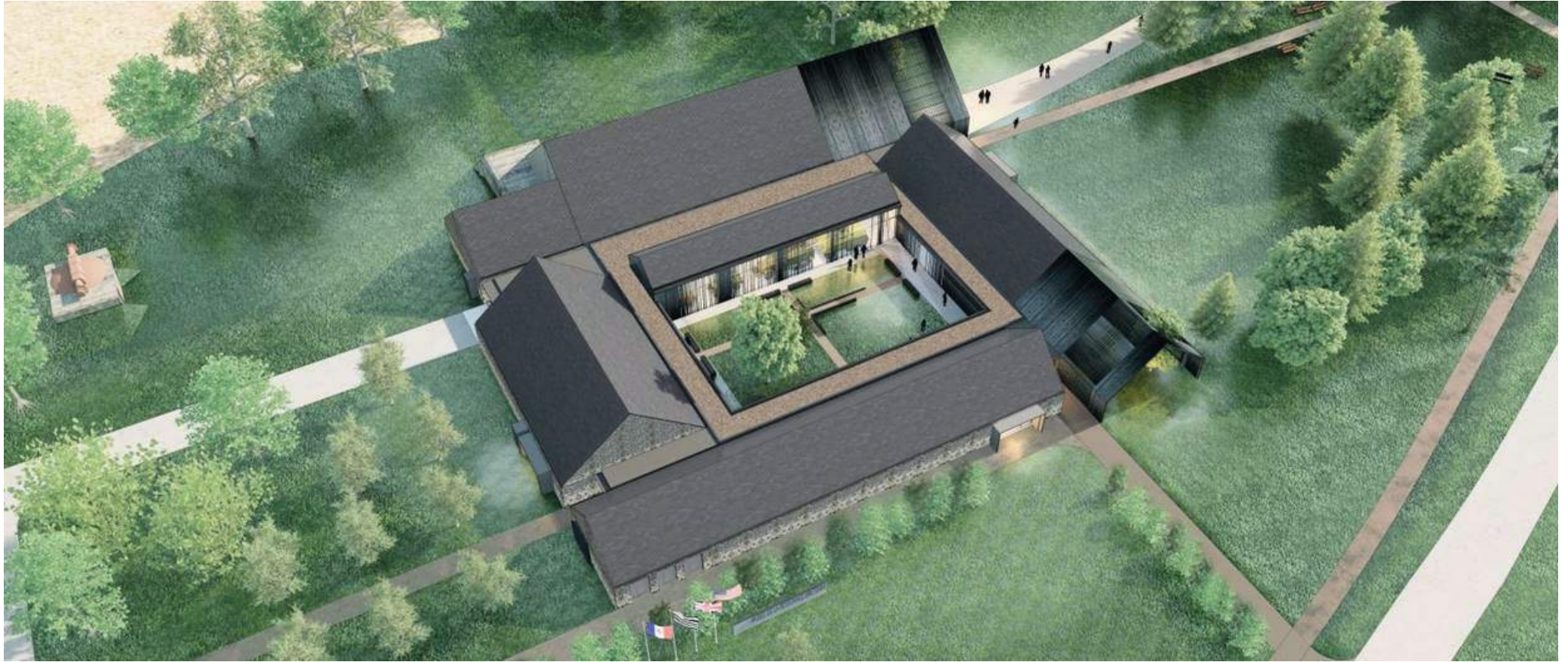
Esquisse de l'extérieur du futur musée