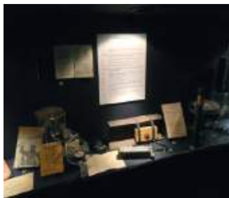
Trois vues des actuelles salles dédiées aux parachutistes français du Spécial Air Service (SAS)